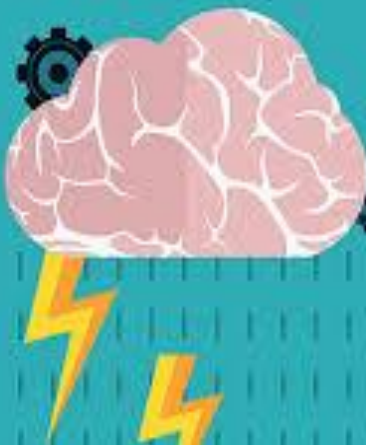
Diagrama de causa e efeito

Treinamento teórico/prático com a meta de 10 DIU por enfermeira