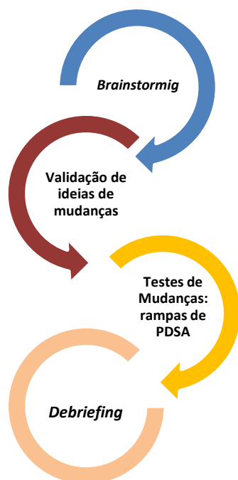
Figura 2: Etapas de inclusão