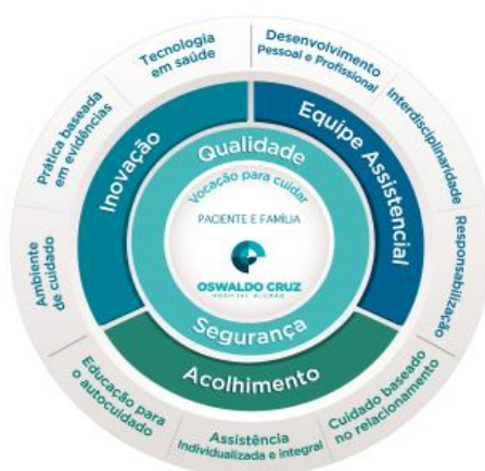
Figura 1: Modelo Assistencial do Hospital Alemão Oswaldo Cruz

O objetivo desse projeto é, portanto, desenvolver e implantar uma teoria de mudança que considere a inclusão do paciente no redesenho do processo de orientação de alta da unidade de terapia intensiva (UTI), aumentando assim de 0 para 95% a participação do paciente/família no processo de orientação de alta da UTI, em 10 meses.