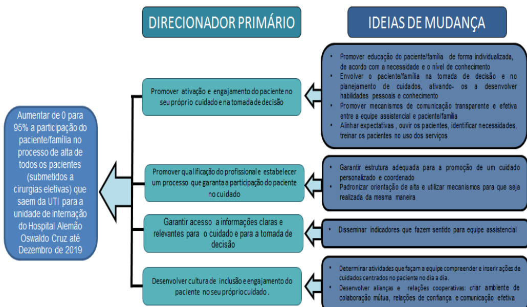
Figura 3: Diagrama Direcionador: Teoria da Mudança