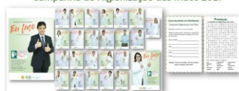
Campanha de Higiene das Mãos 2017