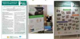
Campanha de Higiene das Mãos 2015